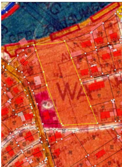
Abbildung 1: Auszug aus dem Flächennutzungsplan der Stadt Pleystein

Die genaue Abgrenzung des Geltungsbereichs ist aus dem nachfolgenden Auszug aus dem Flächennutzungsplan der Stadt Pleystein (siehe Abbildung 1) und dem Entwurf des Bebauungsplans (siehe Abbildung 2) ersichtlich.