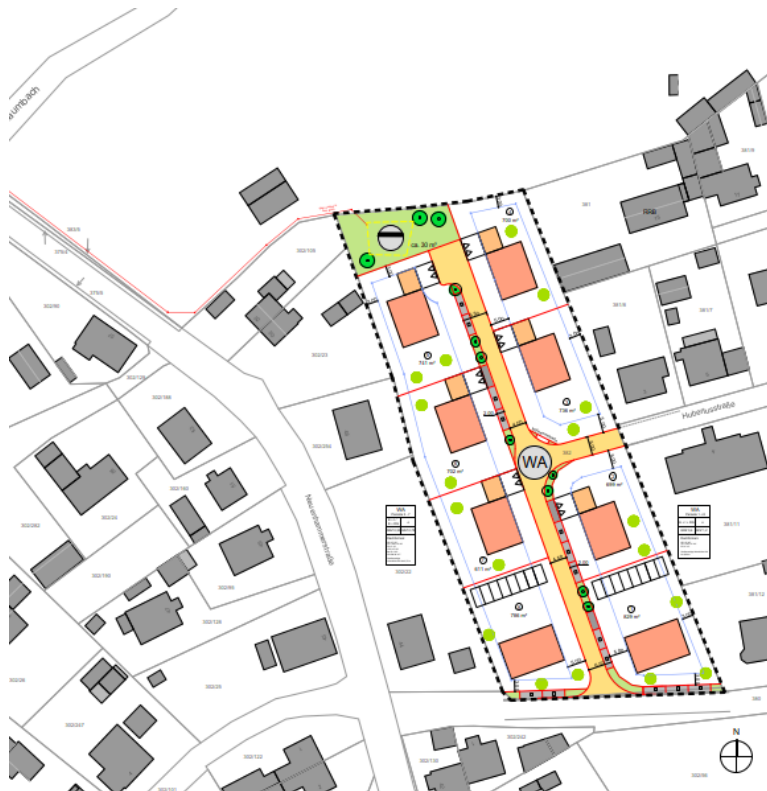
Abbildung 2: Auszug aus dem Entwurf des Bebauungsplans „Am Forsthaus“ der Stadt Pleystein

Frühzeitige Öffentlichkeitsbeteiligung gemäß § 3 Abs. 1 Baugesetzbuch (BauGB)